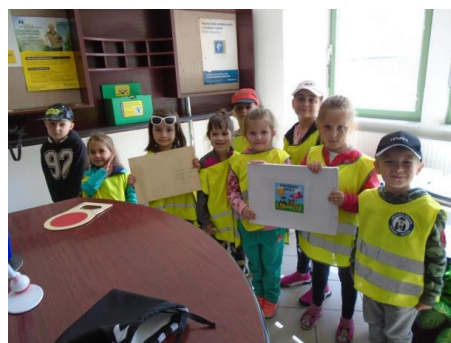
„Autobusem na Lysou horu“