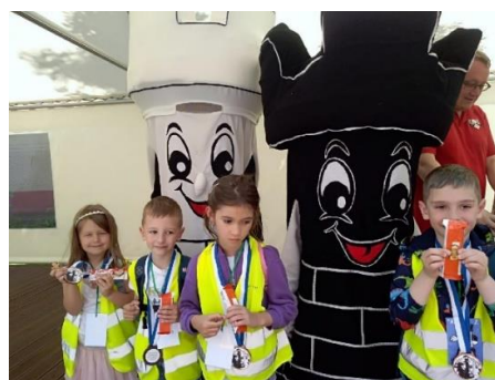
Pracoviště Lískovecká „Svět očima dětí“