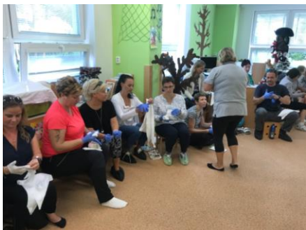
Školení první pomoci